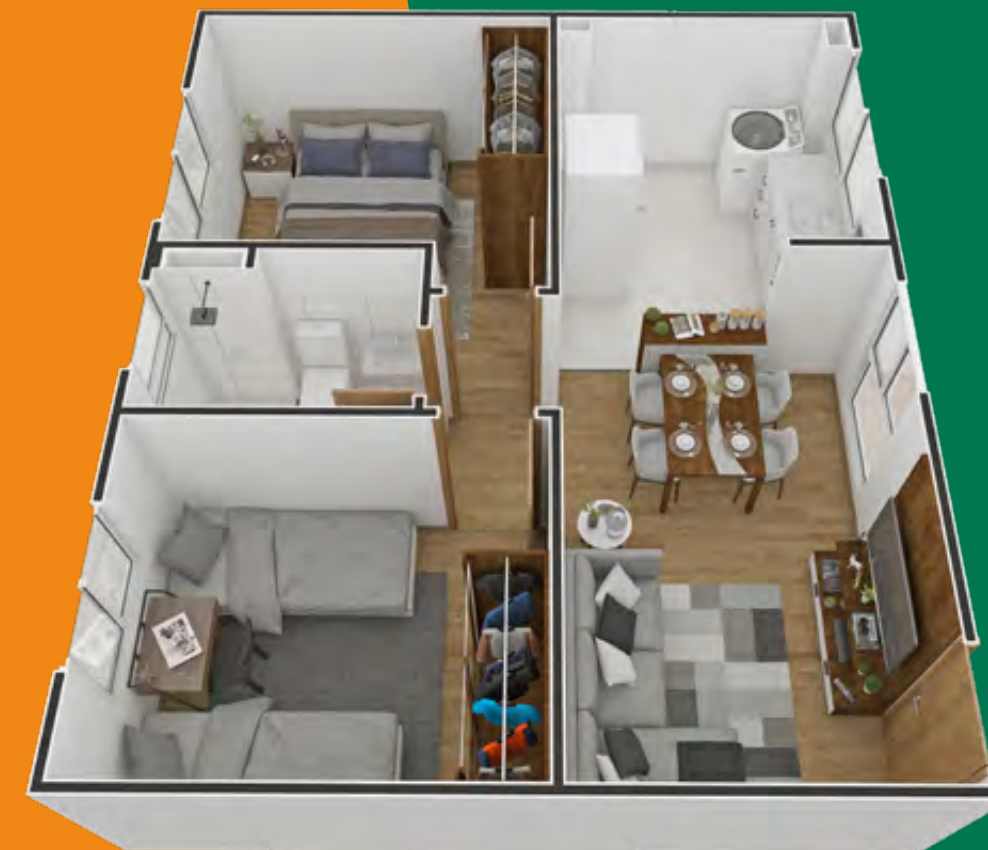
Referência: Apartamento 201 - Bloco 01

Imagem ilustrativa com sugestão de decoração. Os móveis, objetos, revestimentos e demais acabamentos não fazem parte do Contrato. O empreendimento e suas unidades serão entregues conforme Memorial Descritivo. Este empreendimento possui opção de aquisição de Kit Acabamento diferenciado. Imagem sujeita a alterações devido ao desenvolvimento do projeto e compatibilizações técnicas. Interfone: será instalado sistema de intercomunicação entre guarita e unidades privativas que funcionará através da rede de telefonia móvel disponível no local. (para este caso a responsabilidade de contratação da operadora de telefonia e do aparelho será do cliente) ou sistema tradicional com cabeamento (nesse caso será entregue um aparelho de interfone por apartamento). Independente do sistema utilizado as tubulações seca e sondada serão entregues (sem fiação). Será deixada uma previsão de ponto de interfone para elevador (ou para previsão de elevador) no primeiro andar ou no térreo, no hall de escada sem acesso a guarita. Consulte condições de financiamento do Programa Casa Verde e Amarela e avalie se você preenche os critérios para concessão dos benefícios.