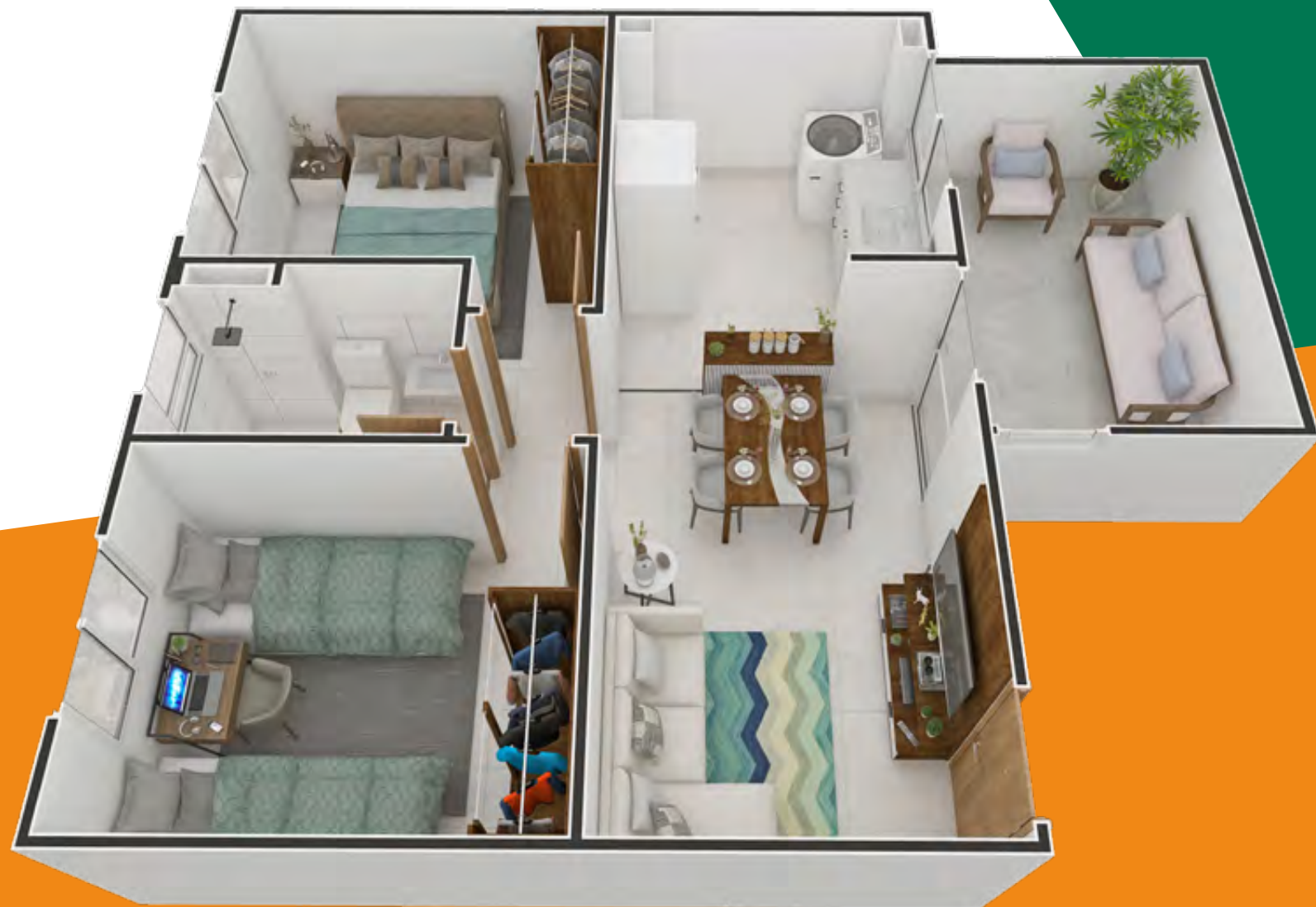
Referência: Apartamento 101 - Bloco 01