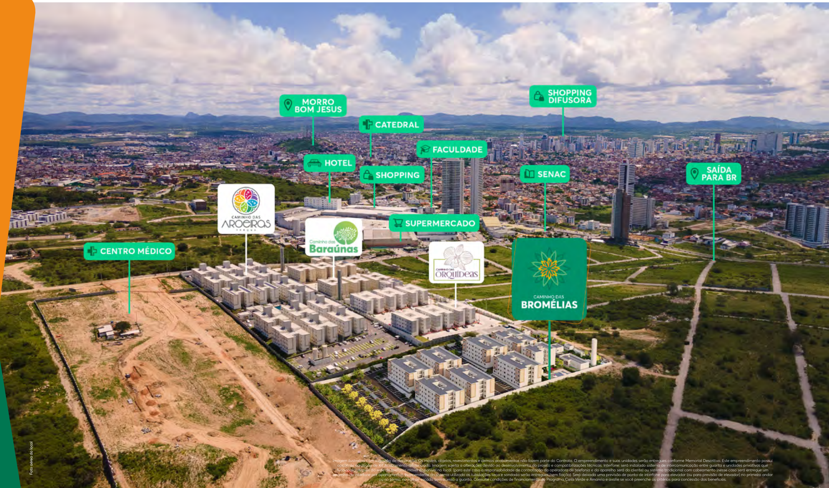
Foto aérea do local

Imagem ilustrativa com sugestão de decoração. Os móveis, objetos, revestimentos e demais acabamentos não fazem parte do Contrato. O empreendimento e suas unidades serão entregues conforme Memorial Descritivo. Este empreendimento possui opção de aquisição de Kit Acabamento diferenciado. Imagem sujeita a alterações devido ao desenvolvimento do projeto e compatibilizações técnicas. Interfone: será instalado sistema de intercomunicação entre guarita e unidades privativas que funcionará através da rede de telefonia móvel disponível no local. (para este caso a responsabilidade de contratação da operadora de telefonia e do aparelho será do cliente) ou sistema tradicional com cabeamento (nesse caso será entregue um aparelho de interfone por apartamento), independente do sistema utilizado as tubulações seca e sondada serão entregues (sem fiação). Será deixada uma previsão de ponto de interfone para elevador (ou para previsão de elevador) no primeiro andar ou no térreo, no hall de escada sem acesso a guarita. Consulte condições de financiamento do Programa Casa Verde e Amarela e avalie se você preenche os critérios para concessão dos benefícios.