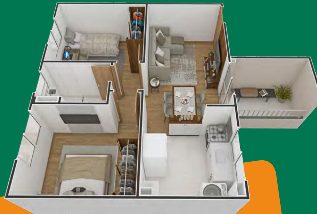
Referência: Apartamento 202 - Bloco 01